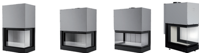
FORMA 75 DX/SX FORMA 95 DX/SX FORMA T95 FORMA T50*

[KW] Potenza termica max Maximum thermal power Puissance calorifique maximum Max. Heizleistung Potencia térmica máx [%] Rendimento Performance Rendement Wirkungsgrad Rendimiento [kg/h] Consumo orario al max Hourly consumption at max Consommation horaire maximum Verbrauch pro Stunde bei Höchstleistung Consumo por hora al máx [Øcm] Diametro uscita fumi Diameter of smoke outlet pipe Diamètre de sortie des fumées Durchmesser Rauchgasaustritt Diámetro salida humos [kg] Peso Weight Poids Gewicht Peso