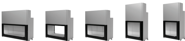
FORMA 115 FORMA B95* FORMA 95 FORMA 75 FORMA 65